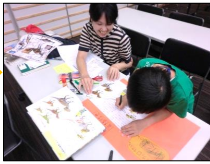
いっしょに発見、いっしょに感動