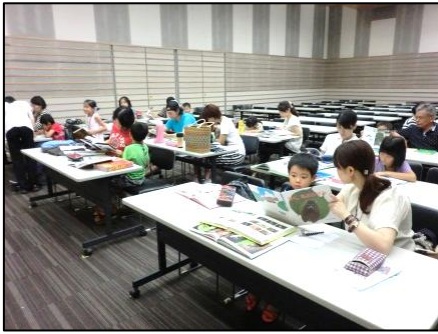
やっぱりなやむ、テーマ決め