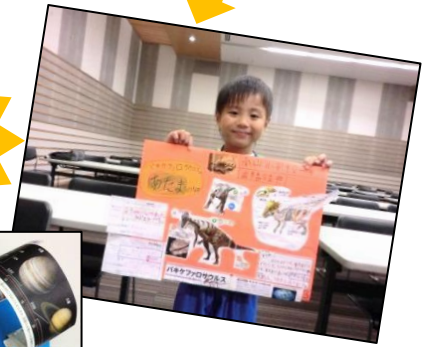
りったいてき さくひん 立体的な作品も!