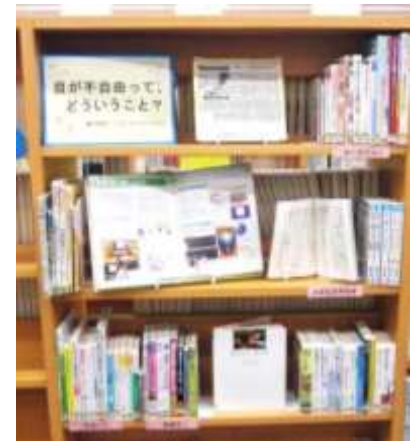
「目が不自由って、どういうこと？」