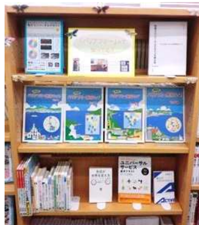
「バリアフリーって知ってる？」