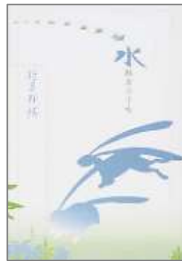
『水瓶座の少女』 野呂邦暢小説集成 7』 野呂 邦暢/著 文遊社 F913.6 ノロ