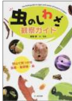
『虫のしわざ観察ガイド』 野山で見つかる食痕・産卵痕・巣』 新開 孝/文・写真 文一総合出版 児童 486 シ

マンホールやパイロン、送水口や地面に埋まっている杭、透かしブロック、道路標識…。数を集めてこそ見えてくる、秘められたデザイン意図と使う人の無意識。街中でよく見かけるアレやコレの鑑賞ポイントを紹介する。