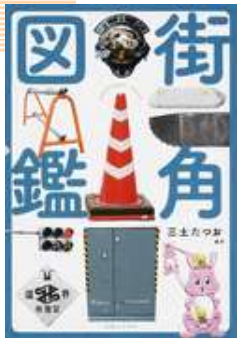
『街角図鑑』 三土 たつお/編著 実業之日本社 H049 ミ

毎月1回月曜日、午後6時20分～午後7時 NHK 総合「イブニング長崎」のコーナーで放送中！