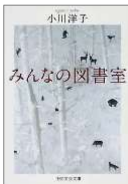
『みんなの図書室』 小川 洋子/著 PHP 研究所 B904 オ