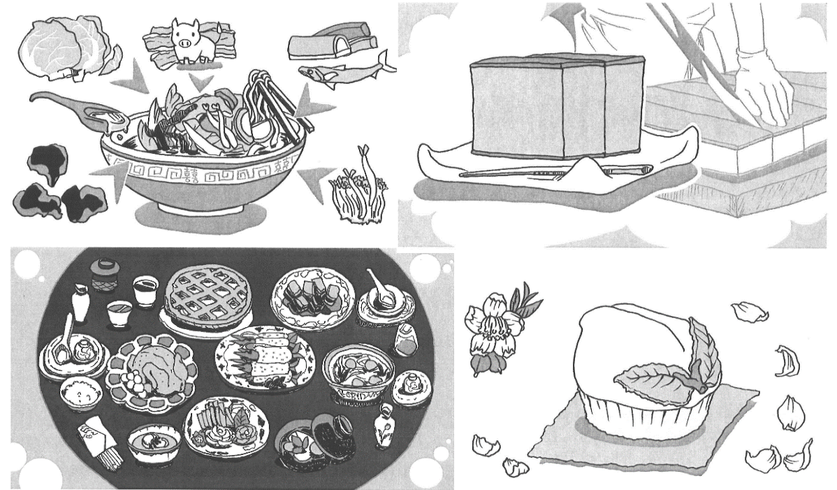
イラスト 川添 紀子

長崎の食文化については、ちゃんぽん・カステラ・皿うどん・ 卓袱料理・普茶料理など、さまざまなキーワードから調べる ことができます。長崎に関する情報を探す際にご活用ください。