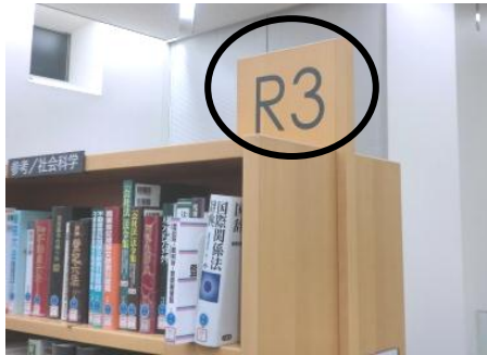
六法全書・法律関連の辞典⇒R3 番の棚