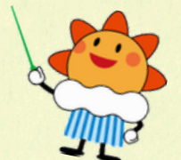
気象庁マスコットキャラクター はるるん

協力：長崎海上保安部・長崎大学教育学部(学生) 日本赤十字社長崎県支部・(一社)日本気象予報士会西部支部 日本防災士会長崎県支部 後援：(一財)日本気象協会・地球ウォッチャーズ—気象友の会—