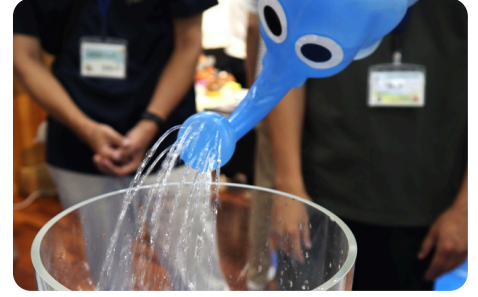
うりょうそくてい