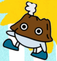
気象庁マスコットキャラクター ほるけん