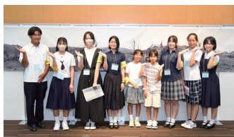
※昨年の写真展の様子（多目的ホール）